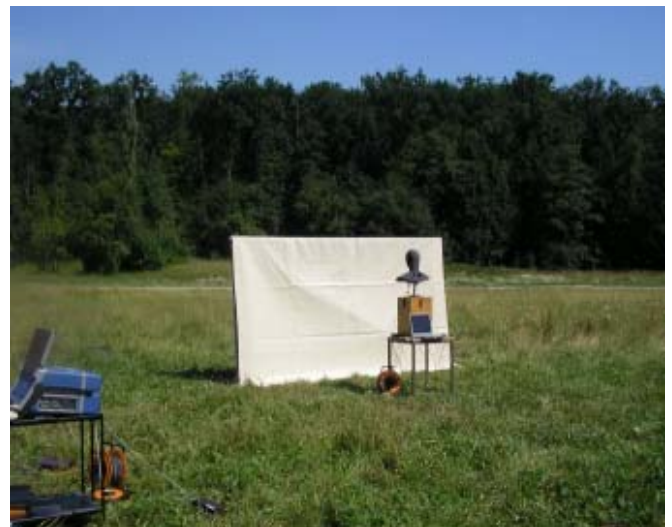
Abbildung 1: Pegelmessungen und Kunstkopfaufnahmen an einer Stellwand aus Folien und Membranen im Freien

Diese Feststellung konnte durch mehrere messtechnische Untersuchungen in einem Halbfreifeldraum und im Freien untermauert werden (siehe Abb. 1 und 2). Durch Kunstkopfaufnahmen wurden, selbst bei Stellwänden aus leichten Folien, beeindruckende Lärminderungen auch nachträglich hörbar vermittelt.