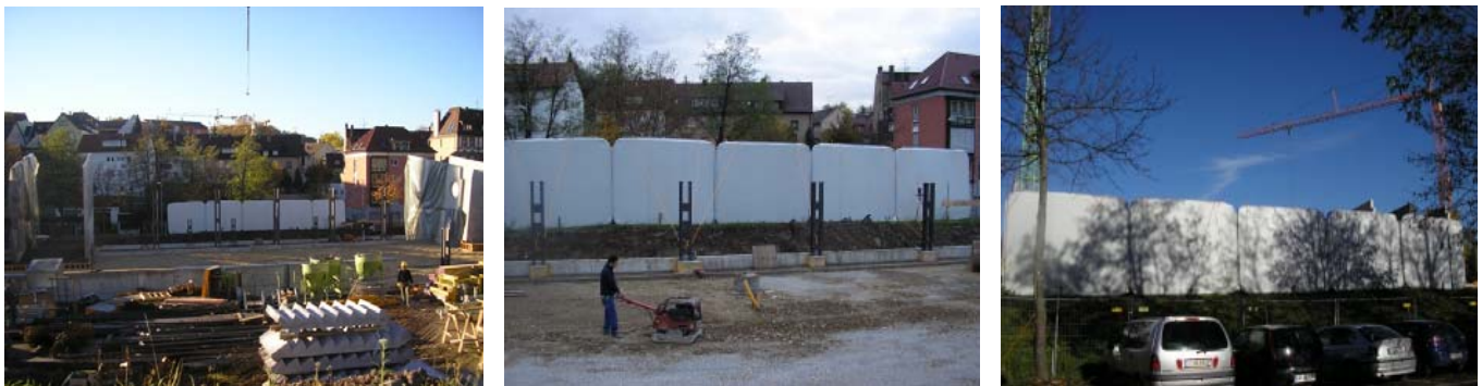
Abbildung 3: Bilder vom Baustelleneinsatz aufblasbarer Abschirmungen an der Baustelle Leuze-Bad Stuttgart (Parkhaus-Neubau): Blick über die Baustelle mit den aufgestellten Elementen (links), Lärmschutz der anliegenden Wohnbebauung bei Bodenverdichtungsarbeiten mit einer Rüttelplatte (mitte) und Ansicht der Abschirmung aus Richtung der Immissionsorte (rechts). Jedes der fünf Elemente hatte die Abmessungen 4,2 m x 3,4 m (B x H). Der Schirm bestand aus zwei Membranlagen ( D = 1,1 \text{ mm} , m'' = 1,4 \text{ kg/m}^2 je Lage), die im aufgeblasenen Zustand durch flexible Kunststoffstege auf 15 cm Distanz gehalten wurden.

Zur Überprüfung der Praxistauglichkeit wurden an zwei ausgewählten Baustellen Prototypen aufblasbarer Abschirmungen aufgestellt und akustisch untersucht (siehe Abb. 3). Dazu wurden neben Schallpegelmessungen auch Kunstkopfaufnahmen und Passantenbefragungen durchgeführt. Der baupraktische Einsatz der aufblasbaren Elemente gestaltete sich überraschend problemlos und zeigte ein großes Mobili-