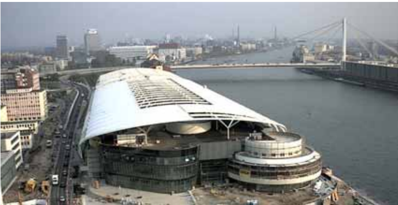
Bilder aus der Bauphase

Eine das gesamte Einkaufszentrum überspannende transluzente Membrandachkonstruktion aus Glasfasergewebe verleiht der Architektur einen unverwechselbaren Charakter.